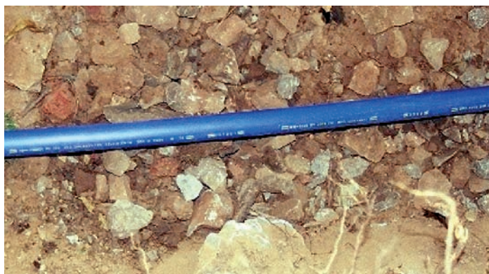
Bild 1: Alternative Verlegung eines Rohres aus Polyethylen (ohne Sandeinbettung)

Als alternative Verlegemethoden (z. B. Wiederverwendung des Aushubs bei offener Bauweise, Einpflügen, Einfräsen, Spülbohren, Berstlining) werden solche bezeichnet, bei denen von den für PE-Rohre vorgeschriebenen Bettungsbedingungen in Sand in der offenen Bauweise (z. B. nach DVGW-Arbeitsblatt W 400-2) abgewichen wird ( Bild 1 ).